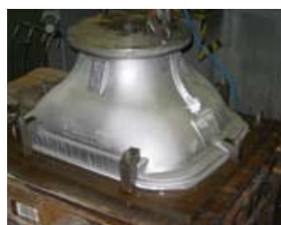
Kundenprüfstand zur Gehäuseprüfung auf Dichtheit