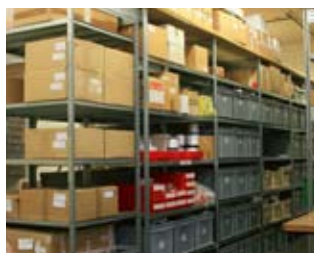
Auszug aus unserem Lager

Wir produzieren für den Kundenbedarf im Tagesgeschäft kostengünstige Lösungen. Sonderanfertigungen sowie Prototypen werden im eigenen Betrieb unter unserem QSM gefertigt. Dabei garantieren wir selbstverständlich auch die von unseren Kunden gewünschte Diskretion.