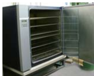
Laborofen für Prüfaufgaben und Testprogramme